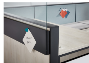
Bare Panel Shield Magnetic Fascia